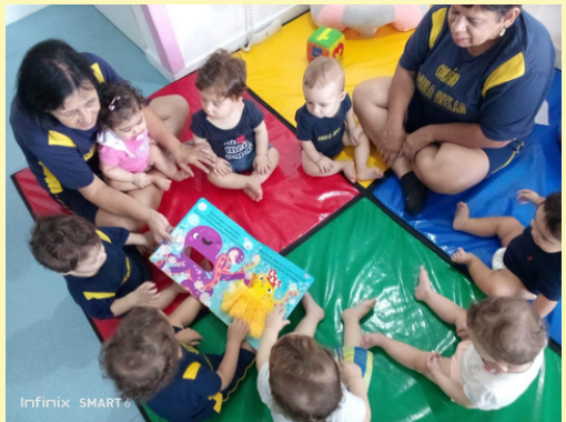
BERÇÁRIO/ INF. I - HORA DA RODA DE LEITURA