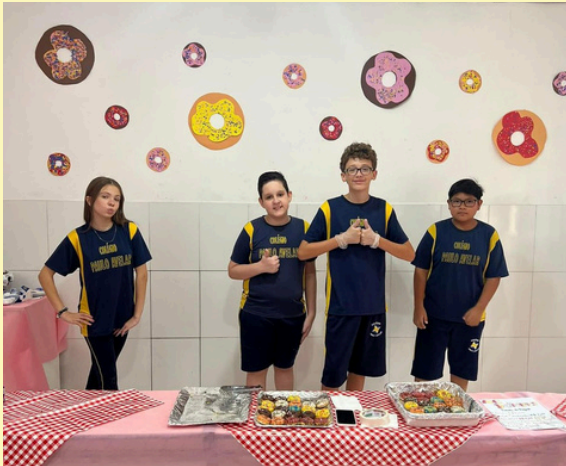
FEIRA DE EMPREENDEDORISMO TURMA: 7º ANO