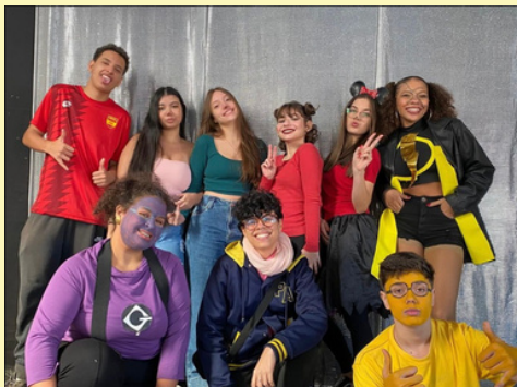
INÍCIO DAS SEXTAS FEIRAS TEMÁTICAS TURMA: 9º ANO