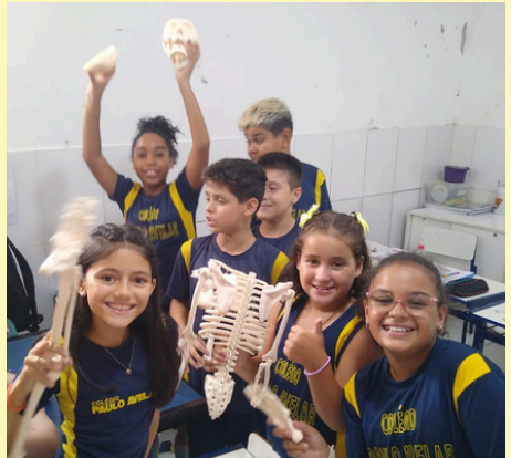
ESTUDO SOBRE O CORPO HUMANO TURMA: 5º ANO