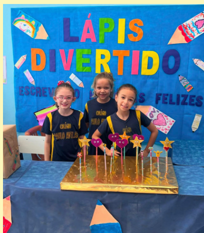
FEIRA DO EMPREENDEDORISMO- TURMA: 2º ANO