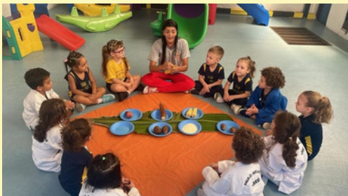
NUTRIR COM ALEGRIA - DIA DOS POVOS INDÍGENAS. APRESENTANDO COMIDAS INDÍGENAS TÍPICAS TURMA: INFANTIL IV