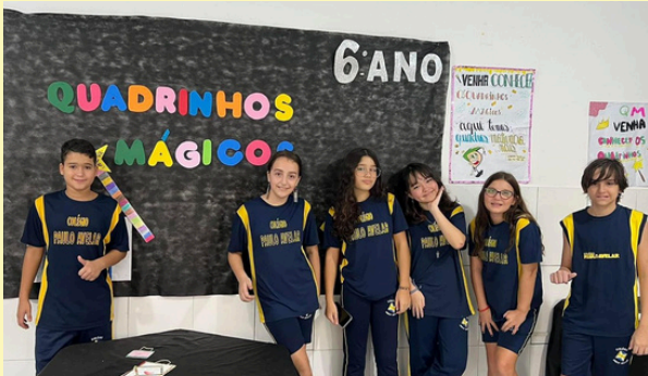
FEIRA DE EMPREENDEDORISMO TURMA: 6º ANO