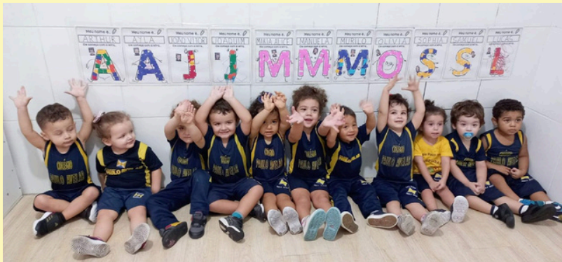
INFANTIL II - APRENDENDO A PRIMIRA LETRA DO NOME