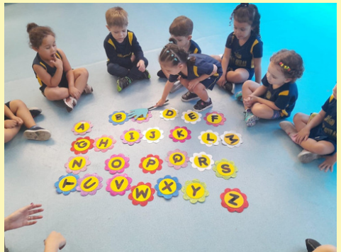
IDENTIFICANDO AS LETRAS DO ALFABETO - TURMA: INFANTIL III