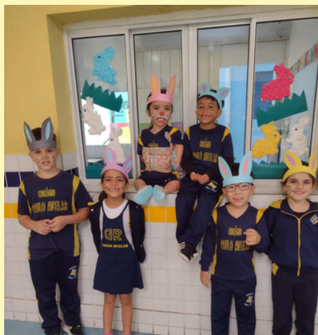
ATIVIDADE DE PÁSCOA 1º ANO

A chegada no Ensino Fundamental é marcado por grandes mudanças na personalidade das crianças, principalmente no que se refere à individualidade de cada um, seu território e sua identidade. A relação do aluno com a escola e com o grupo é o seu desafio. Estimulamos a convivência, damos autonomia monitorada e controlada, evitando abusos e desvios. Este é o momento de ampliar a base da formação cultural dos educandos. Buscamos em nosso Colégio atividades que enriqueçam a bagagem cultural de cada criança, como, por exemplo: feiras culturais, projetos pedagógicos, incentivo à leitura, desafios e pesquisas de campo tanto na escola quanto em casa com seus familiares.