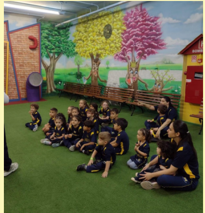
SAÍDA PEDAGOGICA - CIDADE DO LIVRO