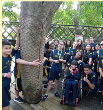
SÁIDA PEDAGÓGICA - PARQUE MAEDA