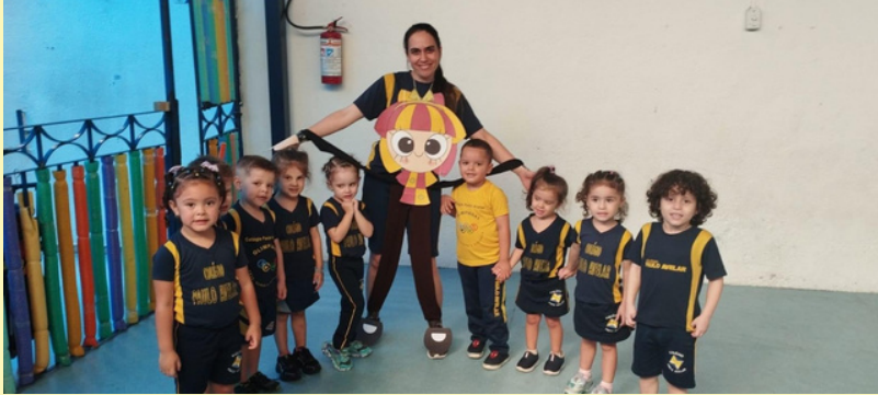
DIA DO LIVRO INFANTIL TURMA: INFANTIL III