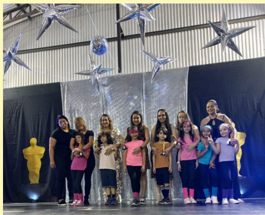
EVENTO DIA DAS MÃES - MINHA MÃE EM HOLLYWOOD TURMA: 3º ANO