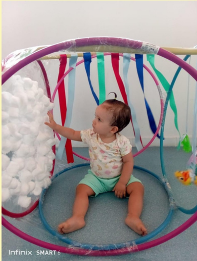
BERÇÁRIO/ INF. I - BAMBOLÊ DAS SENSAÇÕES E TEXTURAS