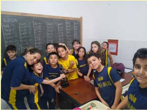
APRENDENDO SOBRE O MICROSCÓPIO ÓPTICO TURMA: 4º ANO