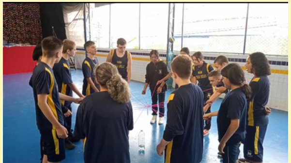
ATIVIDADE EM GRUPO / AULA DE EDUCAÇÃO FÍSICA TURMA: 8º ANO