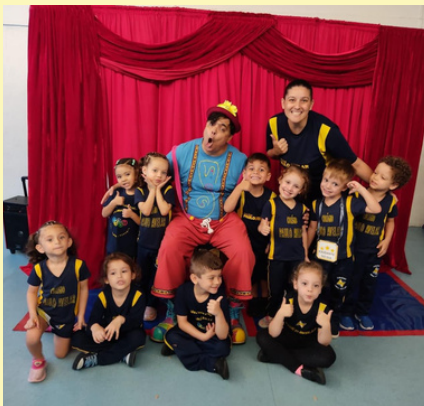
DIA DO CIRCO - VISITA DA COMPANHIA DO TOKTOK TURMA: INFANTIL IV